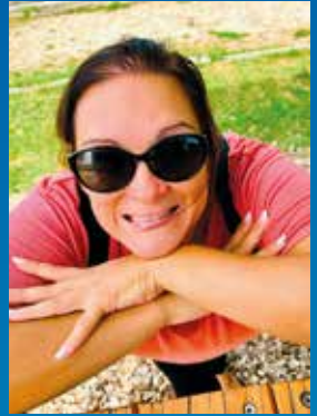
Vice-présidente Responsable Guggenmusik