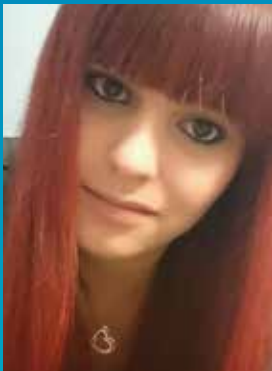
Secrétaire Responsable bénévoles